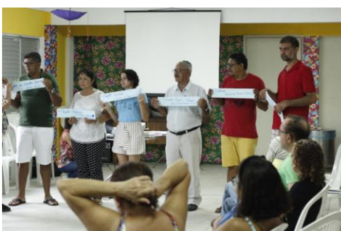
sala 04, B